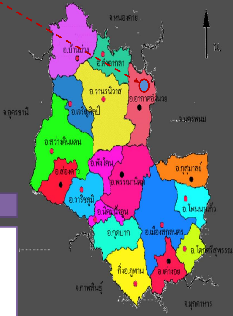
แผนที่จังหวัดสกลนคร